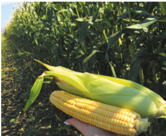
Гибриды кукурузы российской селекции РОСС 130 МВ, РОСС 140 СВ, РОСС 199 МВ, Краснодарский 194 МВ уже много лет востребованы у аграриев и подходят для разных агроклиматических условий.