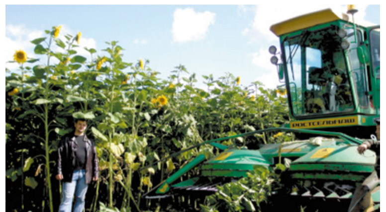
Силосный сорт подсолнечника Белоснежный более 20 лет возделывается передовыми животноводческими хозяйствами как незаменимая страховая кормовая культура. Урожайность зеленой массы 560–1000 ц/га. Морозо-, засухоустойчив.