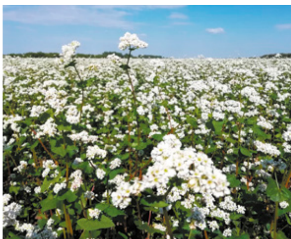
Высокоустойчивые к полеганию, осыпанию и засухе сорта гречихи Инзерская, Дизайн, Флагман.

НАШИ ПАРТНЕРЫ - БОЛЕЕ 800 СЕЛЬХОЗПРЕДПРИЯТИЙ И АГРОХОЛДИНГОВ РОССИИ И КАЗАХСТАНА!