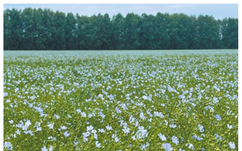
Сорта масличного льна Бирюза, Даник, Северный устойчивы к болезням, адаптированы к возделыванию в различных агроклиматических условиях.