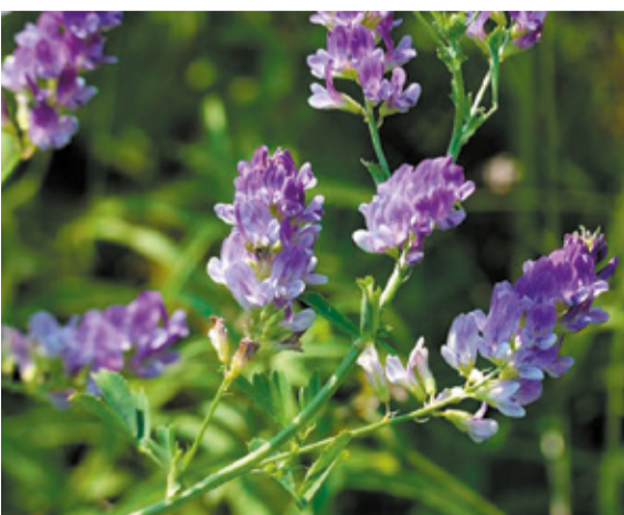
Сорт люцерны Вега 87 дает возможность получать 2-3 укоса зеленой массы за сезон. Характеризуются высоким потенциалом семенной и кормовой продуктивности.