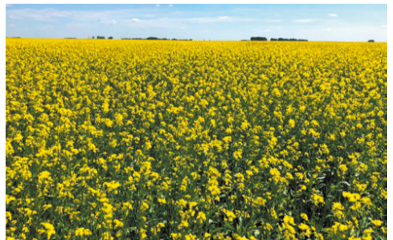
«СибАгроЦентр» предлагает аграриям сорта рапса: Амулет, Сириус, Таврион, Юбилейный, а также семена ярового рапса селекции Сибирской опытной станции ВНИИМК: 55 регион, Гранит. Высокоурожайные, раннеспелые, устойчивые к почвенной засухе и болезням сорта горчицы сарептской Ника, Горлинка.