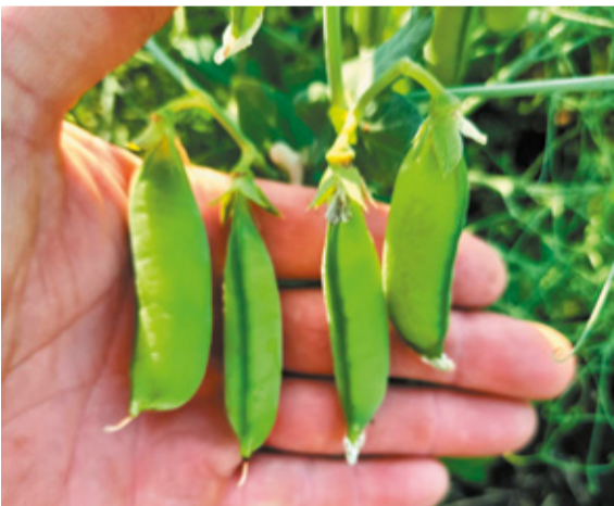
Высокопродуктивный сорт гороха Болдор французской селекции Florimond desprez устойчив к полеганию и преждевременному растрескиванию, с высоким содержанием белка и потенциальной урожайностью 60 ц/га.