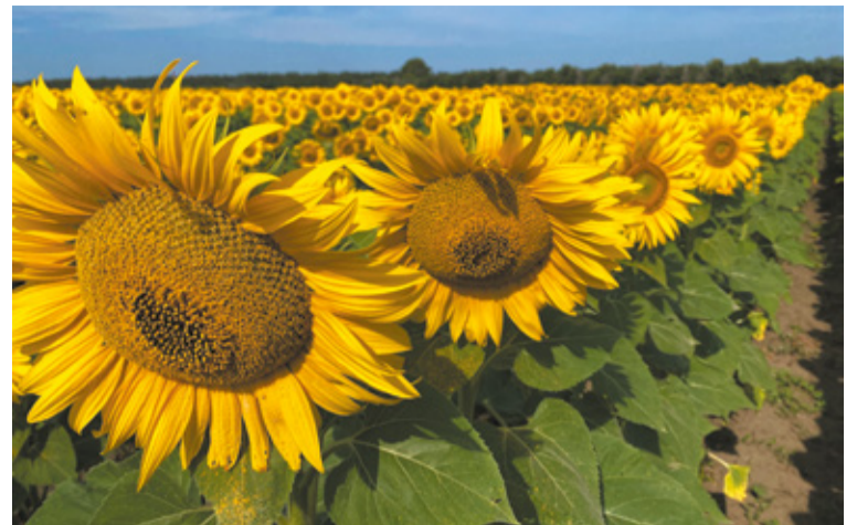
В сезоне 2024-2025 в линейку уже ставших популярными высокопродуктивных гибридов подсолнечника СИНТЕЗ, СОЮЗ, АТОМ, ЮНИОН добавились новые гибриды селекции НПО Алтай для возделывания по технологиям EXPRESS и CLEARFIELD: Вектор SU и Спектр КЛ.

Покупайте хорошие семена! Создавайте хорошие условия! Получайте высокие урожаи!