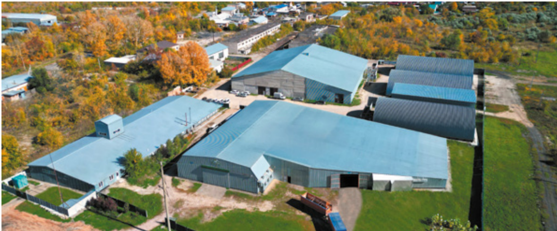
Семенной завод ООО «СибАгроЦентр» — это более 10 тыс. кв. м производственных и складских площадей. Семена отправляются в более 800 сельхозпредприятий и агрохолдингов из 38 регионов России и Казахстана. Введена в эксплуатацию вторая линия по инкрустации семян и упаковке в бумажные мешки по евростандарту. Работают три линии по очистке семян.

Сорта гречихи Дизайн, Флагман, Инзерская характеризуются высокими технологическими и кулинарными качествами, устойчивы к полеганию, осыпанию, болезням и засухе.