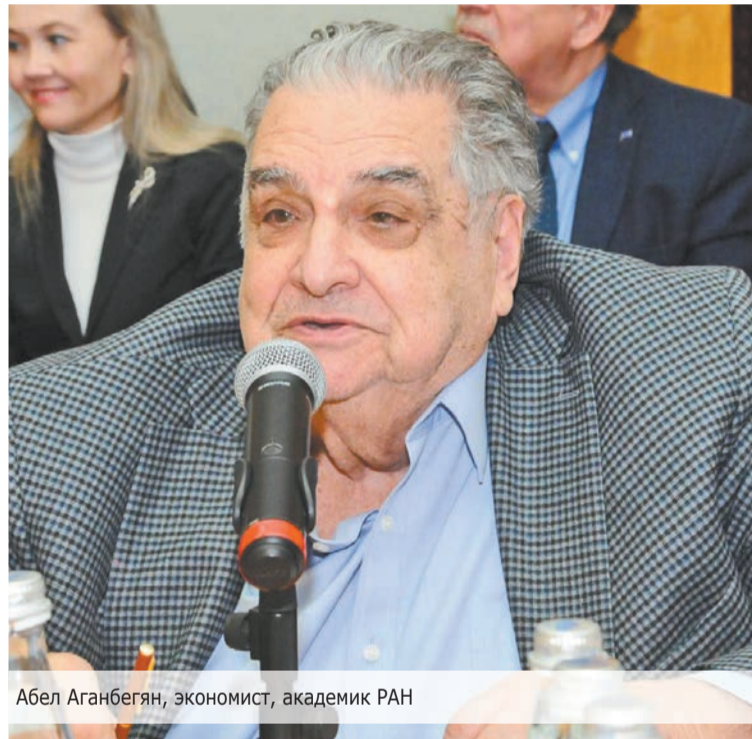
Абел Аганбегян, экономист, академик РАН

– По сокращению доходов и потреблению Россия выглядит хуже большинства стран мира, намного! Ведь развитые страны тратят огромные средства на поддержание доходов населения в кризис. Среди крупных стран нигде реальные доходы не сократились на 15%. В США в кризис они даже выросли. И сейчас в связи с новой программой Байдена, когда каждому будет дано 1400 долларов, у людей с относительно невысоким доходом этот показатель ещё раз повысится.