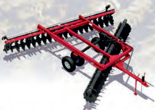
БОРОНЫ ОФСЕТНЫЕ ДИСКОВЫЕ серия DV