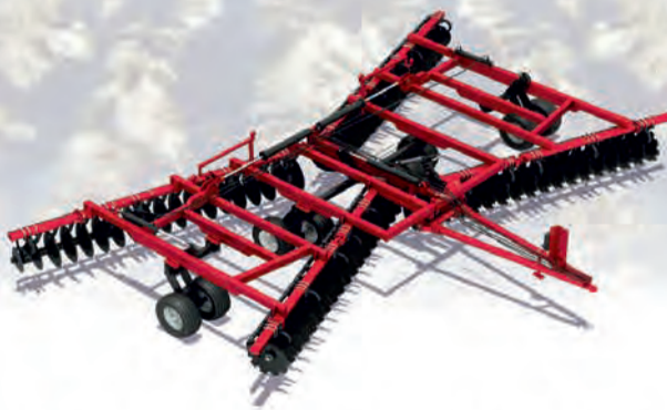
БОРОНЫ ТАНДЕМНЫЕ ДИСКОВЫЕ серия DX