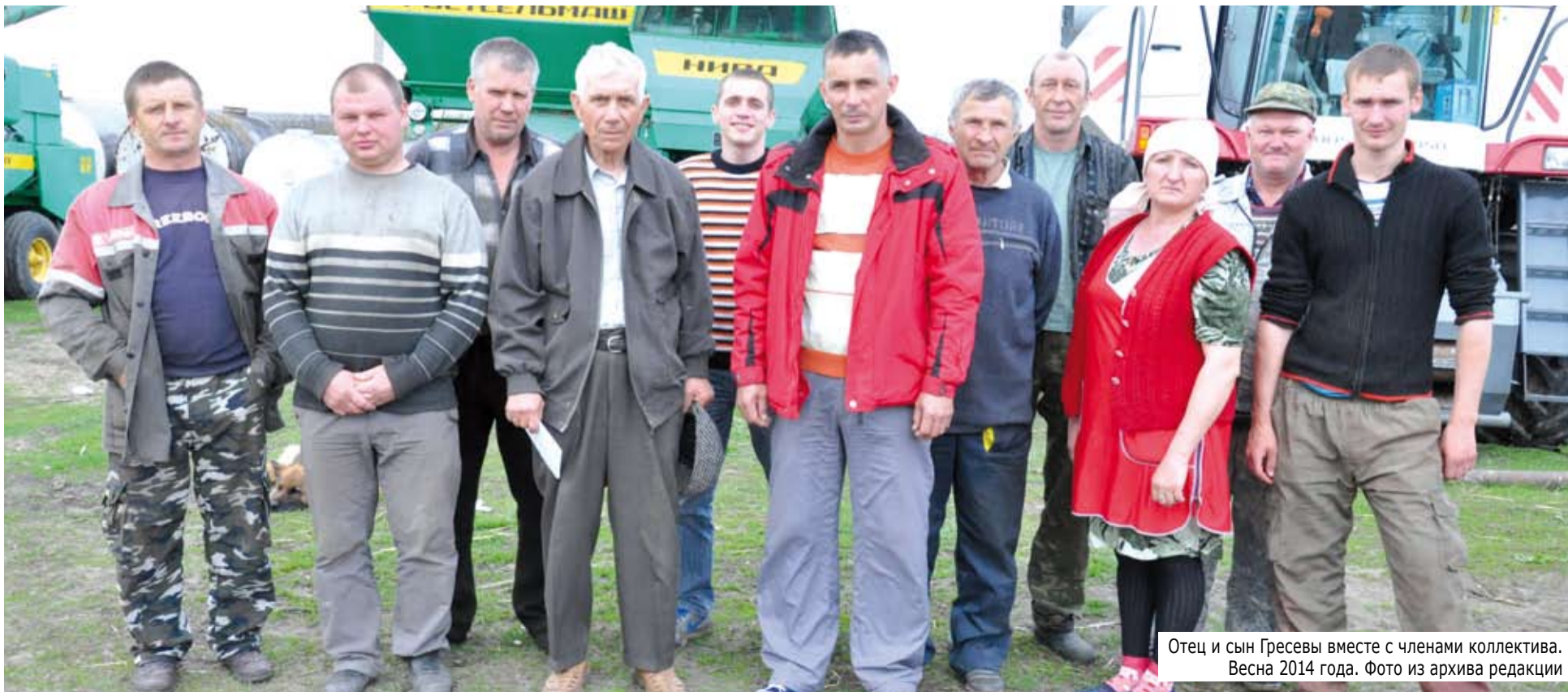
Отец и сын Грессевы вместе с членами коллектива. Весна 2014 года.

– Блох дают, дают, а всё равно блохи есть, пап. Фермерство – это стиль жизни. Человеку же немного надо: работа, отдых, свобода. Я вот люблю кататься на горных лыжах. По 18 спусков делаю. С женой как-то поругались. Звоню ребенку: «Ваня, хочешь