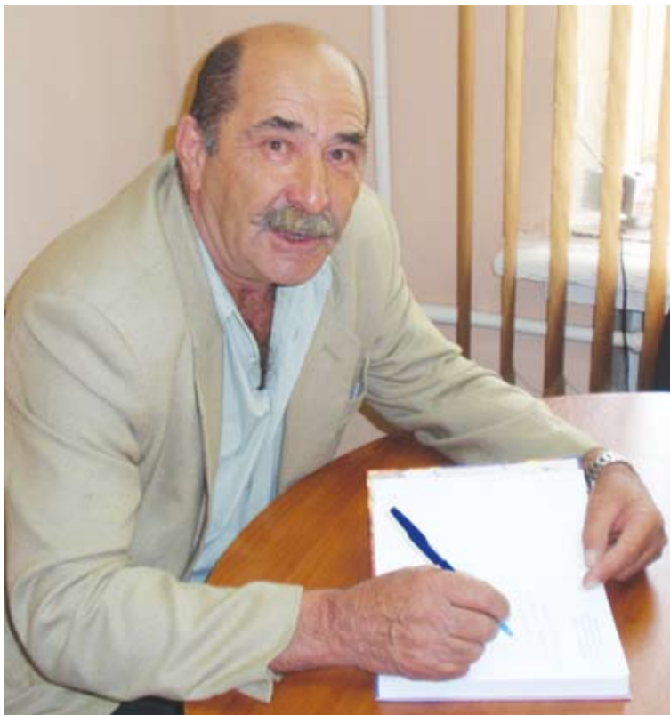
ОКОНЧАНИЕ. НАЧАЛО №№ 45,46 2014Г, №1 2015Г.