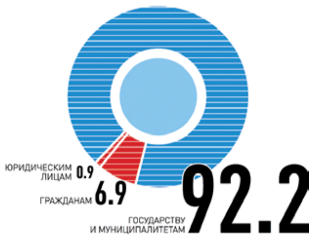
РАСПРЕДЕЛЕНИЕ ЗЕМЛИ В РОССИИ ПО КАТЕГОРИЯМ, % (НА 1 ЯНВАРЯ 2014 ГОДА)