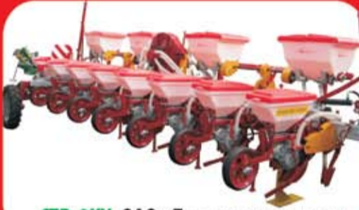
СТВ-8КУ, ОАО «Лидагропромаш»