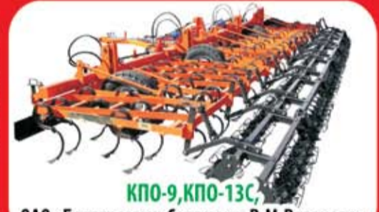
КПО-9, КПО-13С, ОАО «Белагропромаш-Сервис им В.М.Рязанова»