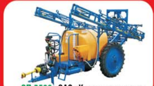
ОП-2500, ОАО «Казаньсельмаш»

410080, г.Саратов, пр-т Строителей, 31 тел./факс: (8452) 47-71-75, 47-71-76, 57-29-78 www.polesie64.ru e-mail: polesiesaratov@yandex.ru