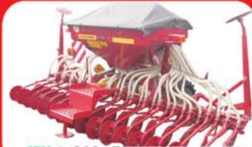
СПУ-4, ОАО «Лидагропромаш»