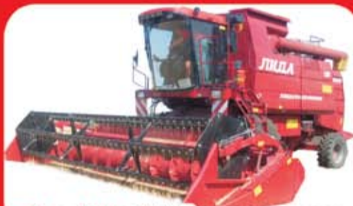
Лида -1300, ОАО «Лидагропромаш»

Большой ассортимент техники из Белоруссии, России и Польши Комбайны • Культиваторы • Прицепы Бороны • Опрыскиватели • Плуги • Сеялки Пресс-подборщики и др.