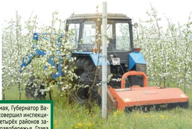
В среду, 14 мая, Губернатор Валерий Радаев совершил инспекционный облёт четырёх районов западной зоны Правобережья. Глава региона осмотрел ход весенне-полевых работ на полях Балашовского, Самойловского, Романовского районов.

Маргарита ВАНИНА