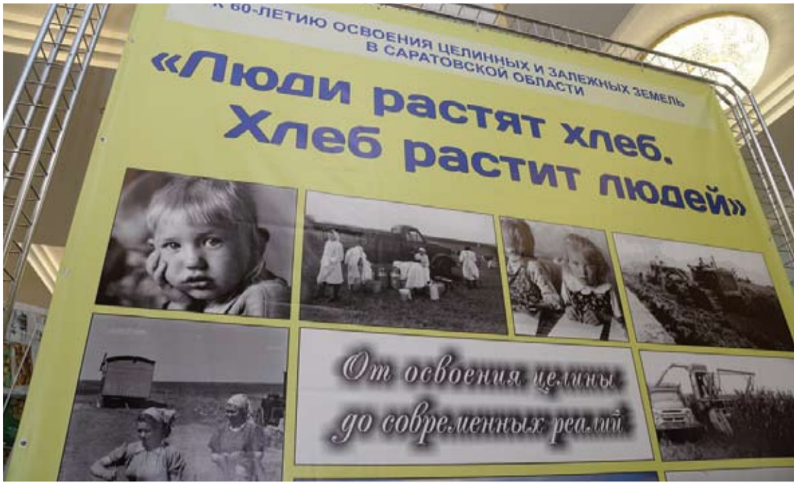
ФОТО С ВЫСТАВКИ