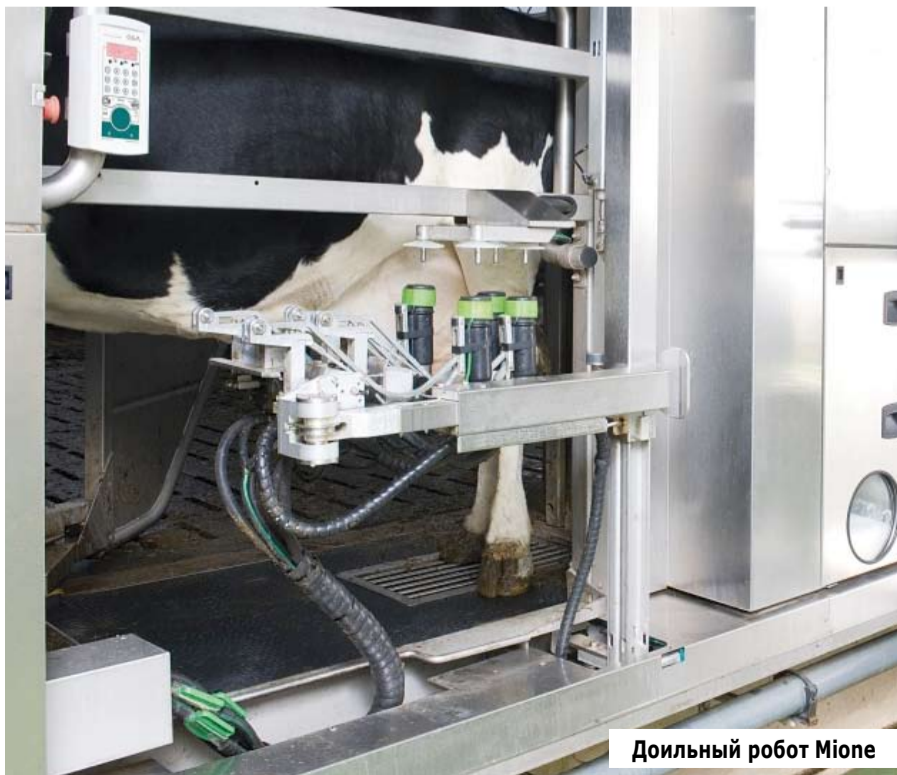
Доильный робот Mione