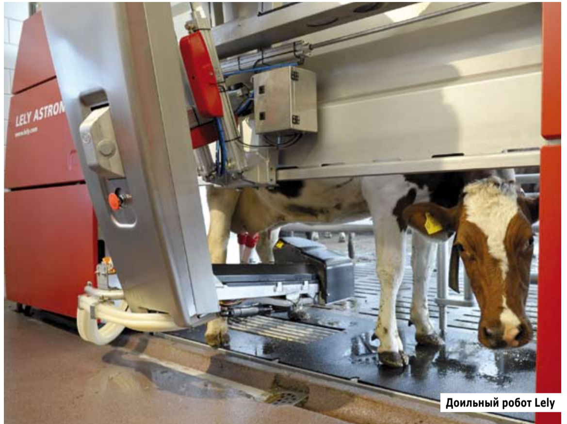
Доильный робот Lely

– Робот способен собирать и анализировать данные более чем по сотне показателей для каждой коровы, что обеспечивает возможность предотвращения различных неблагоприятных ситуаций и предупреждение болезней, – убежден глава «Ферм Ясногорья». – Это дает возможность полного контроля над фермой при