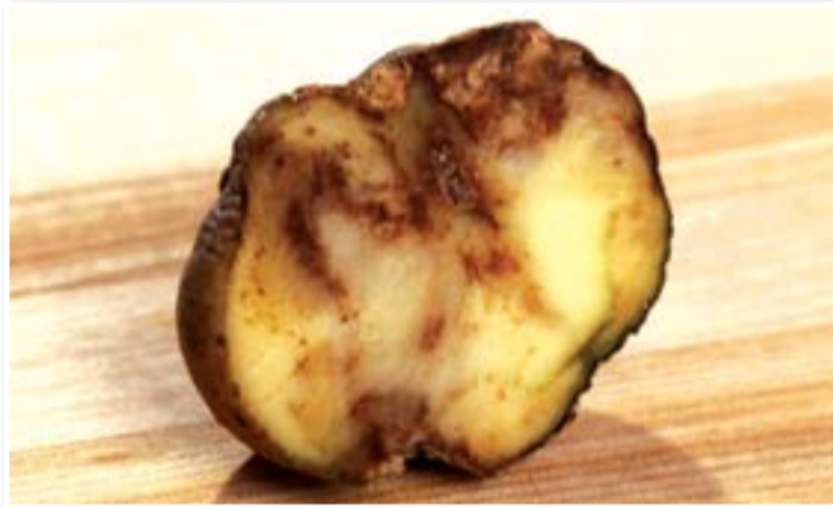
Среди наиболее вредоносных болезней картофеля фитофтороз общепризнанно является одной из опаснейших и широко распространенных на всей территории России, где выращивается эта культура.