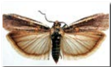
Бобовая (акациевая) огневка (Etiella zinckenella Tr.)

Важное значение в борьбе с вредителями имеет агротехнический метод, который направлен на улучшение развития растений, что способствует повышению их устойчивости и снижению численности вредителей путем создания неблагоприятных условий для их развития. Такие агротехнические приемы, как обработка почвы, применение удобрений и системы ухода за растениями, использование оптимальных сроков сева, уничтожение сорняков и послеуборочных остатков, возделывание устойчивых сортов, позволяют снизить степень поражения растений вредителями.