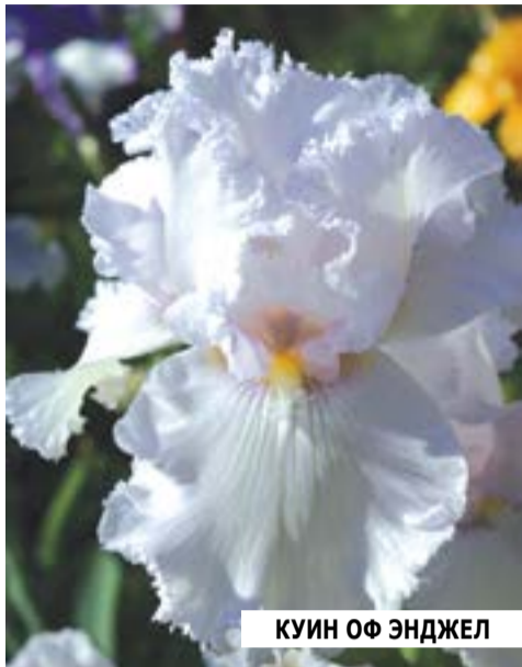
КУИН ОФ ЭНДЖЕЛ