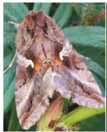
Совка-гамма (Phutometra gamma L.)

Весной, примерно во второй половине мая, вылетают мухи. Самки яйцекладом проделывают в листьях отверстия, в которые откладывают по одному, редко по два яйца. Выступающий в местах ран сок служит пищей для мух. Отродившиеся из яиц личинки, питаясь паренхимой, прокладывают внутри листьев узкие полости (мины), которые, постепенно расширяясь, охватывают весь лист. От этих повреждений верхняя кожица листа вздувается и разрывается. Личинка живет в листе 5–7 суток. Закончив развитие, она падает на землю и окукливается в поверхностном слое почвы. Фаза куколки длится примерно две недели. За вегетационный период нутовая минирующая муха дает 3–4 поколения. Поврежденные личинками листья желтеют, засыхают и опадают, что приводит к большому недобору урожая зерна.