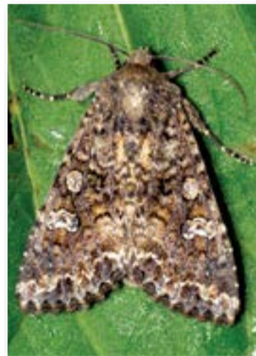
Капустная совка (Barathra brassicae L.)

Куколка длиной 15–20 мм, коричневая. Зимуют куколки в почве. Вылет бабочек первого поколения происходит в мае, второго – во второй половине июля. Самки откладывают яйца по одному на листья бобовых и многих других культурных и сорных растений. Средняя плодовитость самки – до 700 яиц. Спустя 6–9 суток из яиц отрождаются гусеницы. Сначала они скелетируют листья, затем объедают их с краев и выгрызают сквозные отверстия. Гусеницы второго поколения поедают бутоны и цветки, а также проникают внутрь бобов и выедают в них незрелые семена. Закончив через 20–25 суток развитие, гусеницы окукливаются в почве на глубине 2–4 см. Фаза куколки длится 12–15 суток. Куколки последнего поколения люцерновой совки остаются в почве на зимовку.