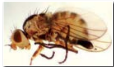
Нутовая минирующая муха (нутовый минер) (Liriomyza cicerina Rond.)

Во второй половине июля и в августе наблюдается массовый лет бабочек второго поколения. Самки откладывают яйца на посевах зернобобовых культур поздних сроков сева, а также на зеленых бобах белой акации. Развитие гусениц нового поколения завершается за 30–40 суток, после чего они уходят в почву на зимовку.