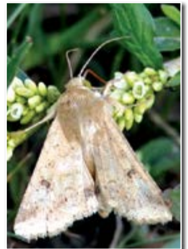
Хлопковая совка (Chloridea obsoleta F.)

Куколка красновато-коричневая, блестящая, длиной 20–24 мм. Зимуют куколки в почве. Лёт бабочек начинается в мае – июне и происходит в ночное время. Самки откладывают яйца на нижнюю сторону листьев гороха, кормовых бобов и других культурных и сорных растений кучками по 10–50 шт. и более. Плодовитость самки составляет 500–800, а иногда превышает 2500 яиц. Через 10–15 суток из яиц отрождаются гусеницы. Сначала они выедают мякоть с нижней стороны листьев, а затем выгрызают в них сквозные отверстия. Развитие гусеницы длится 30–50 суток, после чего они уходят в почву, где на глубине 10–12 см окукливаются. Капустная совка дает 2–3 поколения.