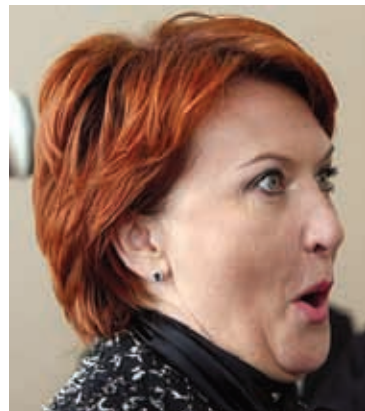
«Прогноз по урожаю – 83–86 млн т»

Новый министр сельского хозяйства рассказал о прогнозе на урожай, будущем ОНФ и своём знаменитом танце