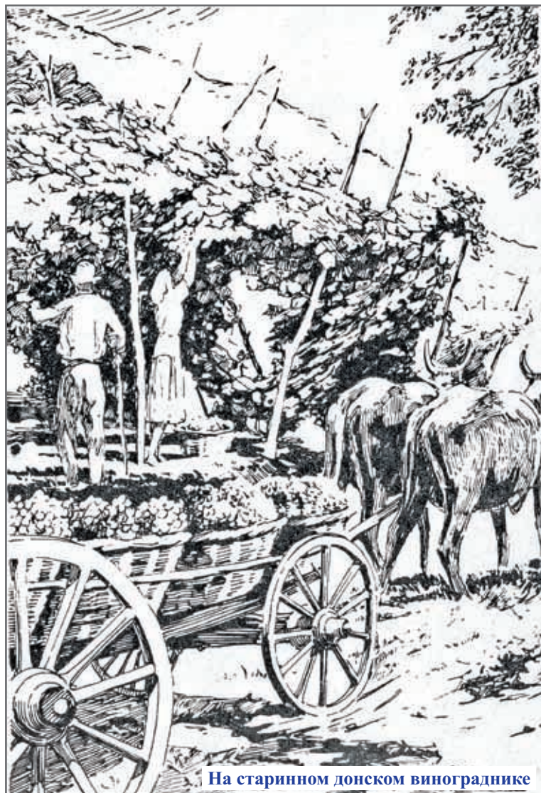
На старинном донском винограднике

«Создавая блага цивилизации, человек нередко разрушает дикий природный ландшафт, то окружение, в котором он эволюционно сложился и без которого он, в сущности, не может нормально существовать. Вот почему, воздействуя на окружающую среду, крайне необходимо всюду, где только возможно, оставлять образцы, эталоны нетронутой природы. Если они, эти эталоны сохраняются, то всегда можно выяснить, что есть ценного, способного помочь человеку» (А.Потапенко «Старожил земли русской», Ростов-на-Дону, 1976 г).