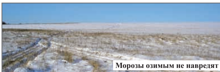
Морозы озимым не навредят