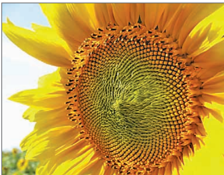
Ежегодно МАИСАДУР Семанс инвестирует 15% от своего торгового оборота в научные исследования

ства и рыболовства Франции на проведение качественных и физических анализов семян. Лаборатория проводит анализ всех партий семян на предмет прорастания в условиях холода и повышенной влажности. В дополнение к стандартным анализам, каждая партия семян подвергается испытаниям в стрессовых условиях: холо-