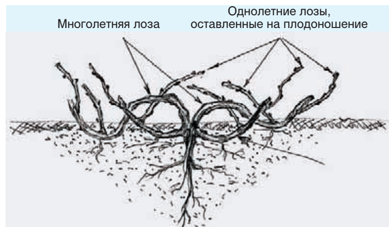
Рис. 1. Приземная форма с многолетними подземными рукавами.

Публикуется в авторской редакции. Продолжение следует